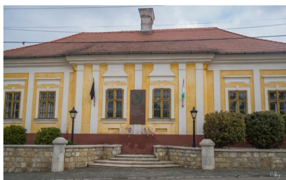
Kossuth Lajos szülőháza